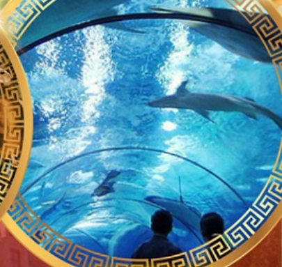
เซี่ยงไฮ้อาเซียนอะควาเรียม