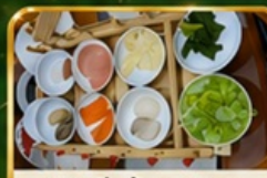
ขนมจีนข้ามสะพาน