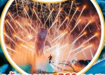
อสังการพลุ 360 องศา