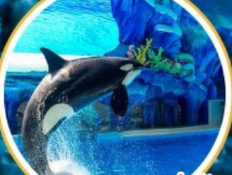
Orca Show สุดน่ารัก