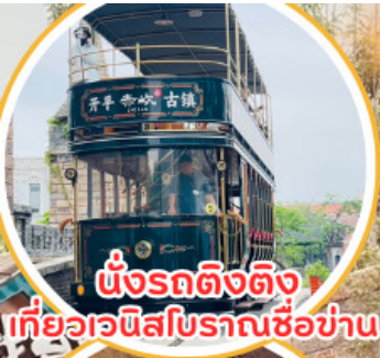
นั่งรถติ่งติ่ง