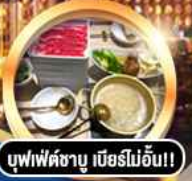
บุฟเฟ่ต์ชาบู เบื่อไม่อั้น!!