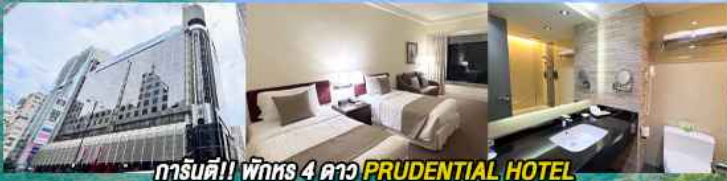
การ์ตูนดี!! พักหรู 4 ดาว PRUDENTIAL HOTEL ติดถนนนาธาน ย่านช้อปปิ้งจิมซาจуй