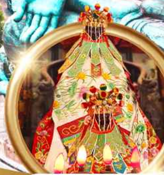
เยี่ยมเงินเจ้าแม่กวนอิมสองฮา