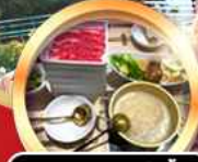
บุฟเฟ่ต์ชาบู เบียร์ไม่อั้น!!