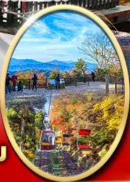
ภูเขา ทาคาโอะ

ปราสาทดสิโมไต Starbuck Snow Peak Land วัดชินโซจิ