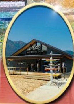
Ao Lakeside Cafe