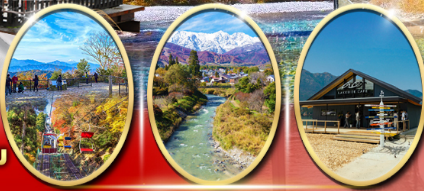
ภูเขา ทาคาโอะ

ปราสาทนัตสึโนะ Starbuck Snow Peak Land วัดเซ็นโซจิ