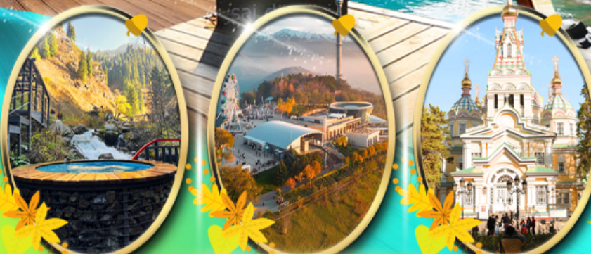
Alma Arasan Gorge

โบสถ์เซ็นต์คาซัน อนุสรณ์สถาน พานฟีลอฟ จุดชมวิว หุบเขามือฉิว พิพิธภัณฑ์เครื่องดนตรี ตลาดรับมาซาร์ ถนน อามันัก Zhibek Zholy ช้อปปิ้ง Mega Mall Almaty