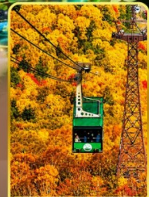
กระเช้าคุโรดากะ