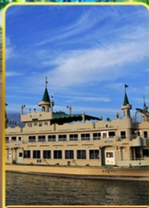
ล่องเรือทะเลสาบโทเยะ