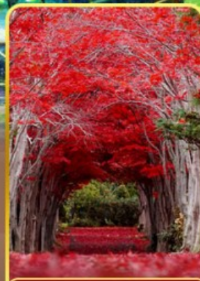
สวนอิระโอกะ