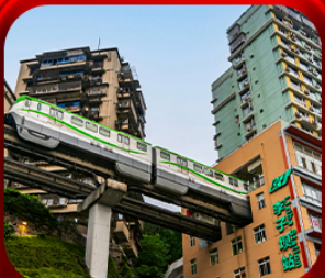
“ นิ่งรถไฟคะลุค ”

บินตรงลงจงซิง • อุ่หลง หลุมฟ้าสะพานสวรรค์ • ระเบียงแก้ว • อุทยานเขานางฟ้า หงหยาดัง • นิ่งรถไฟคะลุค • ศาลาประชาชน (ด้านนอก) • หลงหมินฮ่าว มรดกโลกผาหินแกะสลักต้าจู่ • วัดหลิวฮั่น • ตึกตะเกียบ • หมู่บ้านโบราณสี่ซีโง่ว