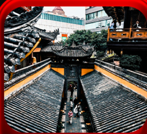
“ วัดหลิวฮั่น ”