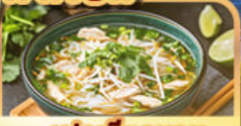
เฟอเวียดนาม