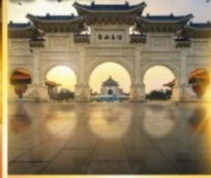
อนุสรณ์เจียงโตเซค