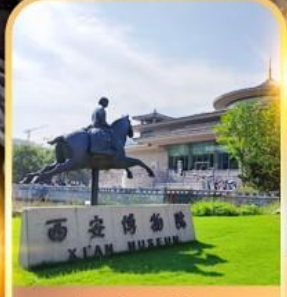
พิพิธภัณฑที่ซีอาน