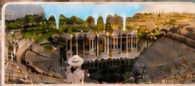
เมืองเซียราโพลิส