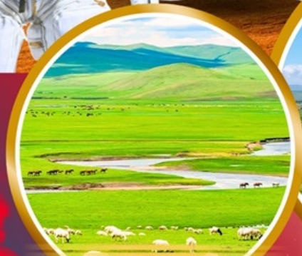
ทุ่งหญ้าออร์โดส

พิเศษ!!! สวมชุดของโกเลีย นอนกระโจมของโกเลีย