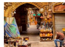
ตลาดชานเอลคาลีลี

20.50 น. ออกเดินทางสู่อิสตันบูล เที่ยวบิน TK695