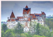
เมืองบราซอฟ