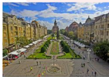
เมืองซีบีอู