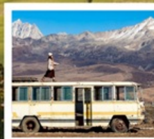
เมืองลอยฟ้าเก๋ตี้ลามู่

ทัวร์คุณธรรม ไม่ลงร้านช้อปปิ้ง ไม่ขายออฟชั่น