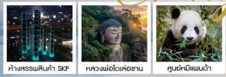
ห้างสรรพสินค้า SKP หอวงม่อโตเล่อซาน ศูนย์หมีแพนด้า