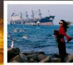
เรือลู่วิค