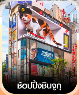
ซ้อปิ้งชินจูกุ