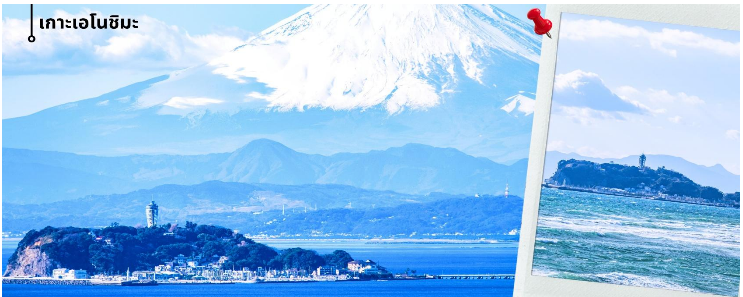
📍 เกาะเอโนะชิมะ

10.45 น. เดินทางถึงสนามบินนาริตะ ประเทศญี่ปุ่น หลังจากผ่านพิธีตรวจคนเข้าเมืองและศุลกากรแล้ว นำท่านขึ้นรถโค้ชปรับ อากาศ เดินทางออกจากสนามบิน เพื่อ นำท่านเดินทางรับประทานอาหารเที่ยง เที่ยง รับประทานอาหารเที่ยง BENTO SET (2) ท่านเดินทางสู่ เกาะเอโนะชิมะ (ใช้เวลาเดินทางประมาณ 1 ชั่วโมง 30 นาที) ผ่านสะพานเอโนะชิมะ เบนเท็น ซึ่งเป็น เส้นทางเชื่อมระหว่างแผ่นดินใหญ่กับตัวเกาะ ระหว่างทางสามารถชมบรรยากาศของท้องทะเลและวิวชายฝั่งได้อย่าง เพลิดเพลิน และในวันที่อากาศแจ่มใสยังสามารถมองเห็นภูเขาไฟฟูจิได้จากกระยะไกลอีกด้วย