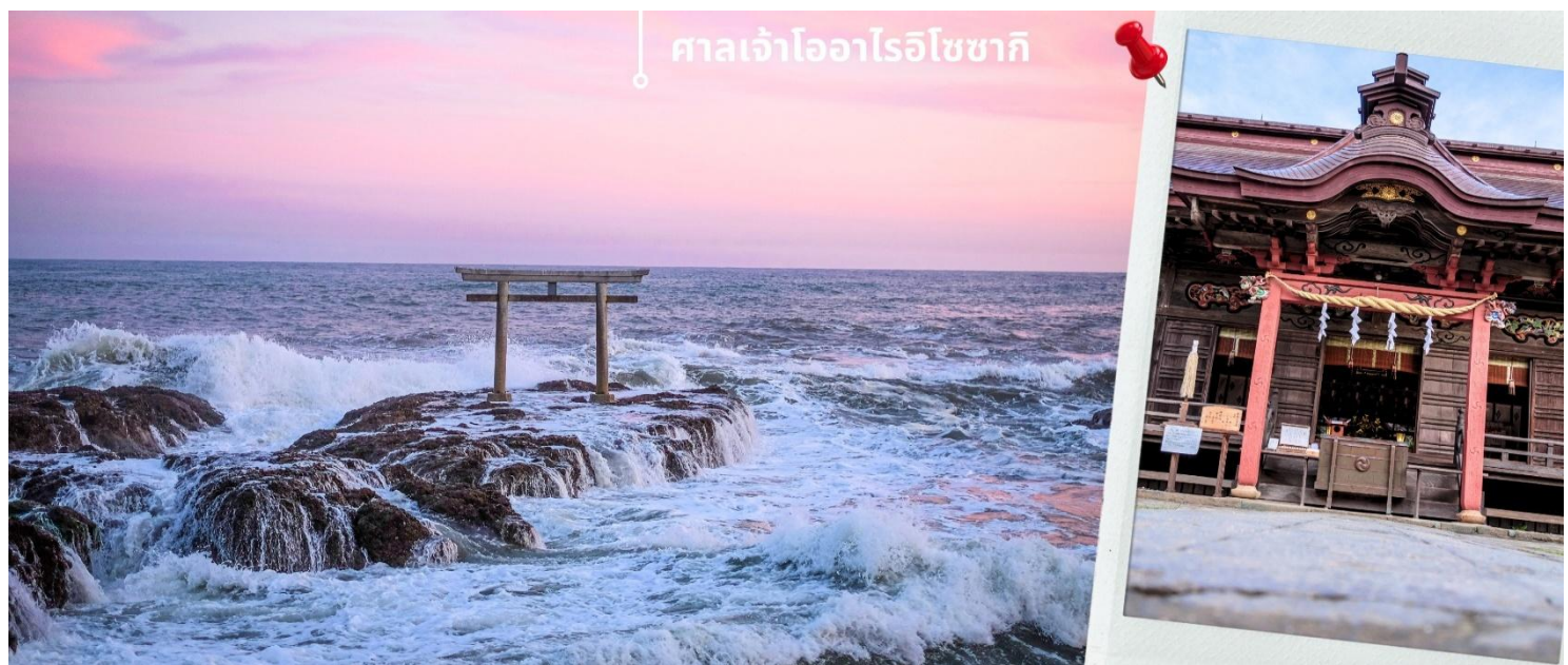
ศาลเจ้าโออาริอิโซซากิ

นำท่านเดินทางสู่ ศาลเจ้าโออาริ อิโซซากิ ตั้งอยู่ที่ เมืองโออาริ (Oarai) จ.อิบารากิ (Ibaraki) มีโลเคชั่นที่คนญี่ปุ่น รู้กันว่าสามารถชมพระอาทิตย์ขึ้นและพระอาทิตย์ตกได้สวยงามที่สุด อีกทั้งบรรยากาศและอารมณ์ก็จะแตกต่างกันไปตามสภาพอากาศและฤดูกาล จุดที่นิยมถ่ายรูปหรือจุดไฮไลท์ที่สุดคือ จุดที่มองเห็นซุ้มประตูโทริอิ (Torii) ตั้งอยู่บนโขดหินริมทะเลออก ซึ่งแยกออกมาจากในเขตด้านใน ของศาลเจ้าโออาริอิโซซากิ นอกจากนี้จะเป็นจุดชมพระอาทิตย์แล้ว ศาลเจ้าแห่งนี้ ยังมีประวัติที่ยาวนาน โดยสร้างขึ้นเมื่อปี ค.ศ. 856 และเป็นที่ประดิษฐานของเทพเจ้าโอนามุจิโนะมิโกโตะ (Onamuchi no Mikoto) และเทพเจ้าสุคุนาฮิโคนะโนะมิโกโตะ (Sukunahikona no Mikoto) เชื่อกันว่าเทพเจ้าทั้งสองเป็นผู้นำความอุดมสมบูรณ์และความมั่งคั่งมาให้ประเทศญี่ปุ่น ผู้คนมักจะขอพรให้สุขภาพแข็งแรงและหายจากโรคร้าย ขอให้มีความสุขในการดำเนินชีวิต สมหวังในเรื่องการแต่งงาน มีคุณธรรมและปัญญา อีกด้วย