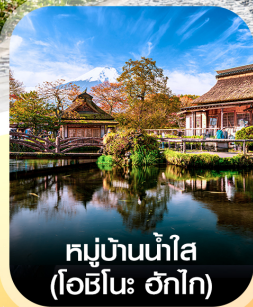
หมู่บ้านน้ำใส (โอชิโนะ วิกโก)

✈️ คอนเฟิร์ม ออกเดินทาง ทุกพีเรียด 2 ท่านขึ้นไป