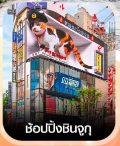
ซูปปังชินจูกุ