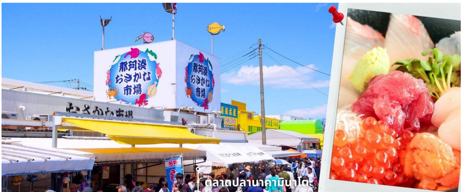
ตลาดปลานาคามินาโตะ

จากนั้นนำท่านเดินทางสู่ ตลาดปลานาคามินาโตะ Nakaminato Fish Market เป็นตลาดปลาที่ใหญ่และมีปลาสดๆ มากมายเทียบกันได้ที่ตลาดปลาซึกิจิ ตลาดปลานาคามินาโตะตั้งอยู่ตามแนวริมน้ำในเมืองมินะโตะ-ฮอนโซ