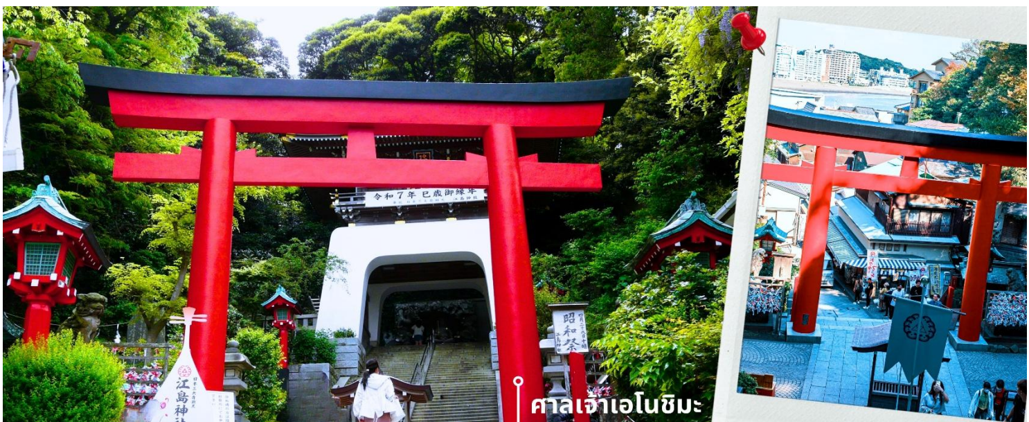
📍 ศาลเจ้าเอโนะชิมะ

จากนั้นนำท่านสักการะ ศาลเจ้าเอโนะชิมะ ศาลเจ้าศักดิ์สิทธิ์ที่ตั้งอยู่บนเนินเขาของเกาะ โดดเด่นด้วยบันไดทางขึ้น ที่ทอดยาวผ่านซุ้มประตูโทริอิและอาคารศาลเจ้าหลายจุดเรียงต่อกัน ภายในประดิษฐานเทพเบนไซเท็น เทพแห่งโชค ลาภ ศิลปะ และความสำเร็จ บรรยากาศโดยรอบเงียบสงบ รายล้อมด้วยธรรมชาติ เหมาะสำหรับการขอพรและ สัมผัสวัฒนธรรมญี่ปุ่นแบบดั้งเดิม จากนั้นให้ท่านได้อิสระเดินเล่นบริเวณ ถนนเบนเซนเท็น นากามิเสะ ซึ่งเป็นถนน