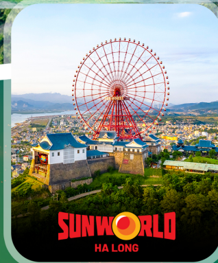
SUNWORLD HA LONG