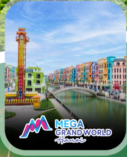
ไฮไลท์ทั้งหมด