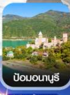
ป้อมอนาบุรี

คอนเฟิร์มออกเดินทาง ทุกพีเรียด 2 ท่านขึ้นไป