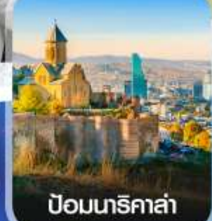
ป้อมนาริ کالا