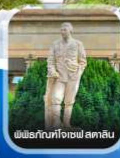
พิพิธภัณฑ์โจเซฟ สตาลิน