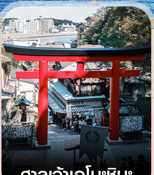
ศาลเจ้าเอโนะชิมะ