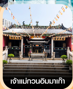
เจ้าแม่กวนอิมมาเก๊า

คอนเฟิร์มออกเดินทาง ทุกพีเรียด 2 ท่านขึ้นไป