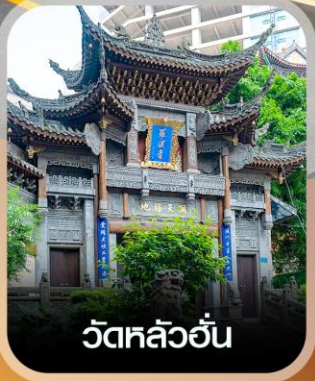
วัดหลิวอัน