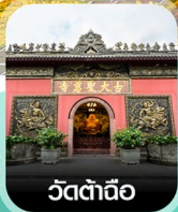
วัดต้าถิอ