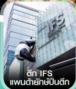
ตึก IFS แพนด้ายักษ์ป็นตึก