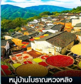
หมู่บ้านโบราณหวงหลิง (หมู่บ้านตากพรัก)