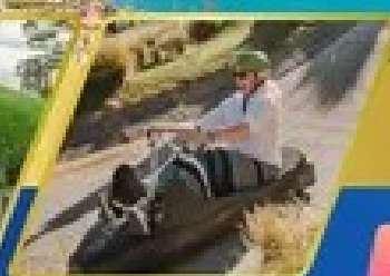
เล่นลuge ที่กรีนสทาวน์

AUCKLAND / ROTORUA / CHRISTCHURCH FOX GLACIER / FRANZ JOSEF / QUEENSTOWN พักโรงแรม 2 คืน / โรตอร์ว 1 คืน / พักโฮสเทล 2 คืน พักฟรานซ์โจเซฟ 1 คืน / คริบส์ทาวน์ 2 คืน