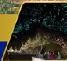
ดำหนอบเรื่องแกะ