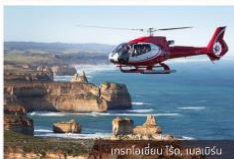
เกรทโอเชียน โรด, เมลเบิร์น