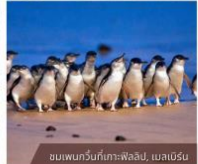
ชมเพนกวินที่เกาะฟาลลิป, เมลเบิร์น