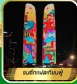
ชมตึกแฟลตเทียนฟู่