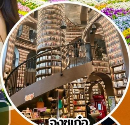
จงซูเก๋อ

สวนสวรรค์แห่งดอกไม้MANHUA-จงซูเก๋อ-จัดรู้อย่างเทียนวู-รูปปั้นแพนด้าเซลล์ เมืองโบราณกวนเซี่ยน-อุทยานเขาสีดรุณี(รวมรถอุทยาน)-สะพานหนานเจียว เมืองลั่วใต้-ตึกแฝด-SKP-วัดต้าจื่อ-ถนนคนเดินซุนซีลู่-IFS-ตงเจียวจี้-ถนนคนเดินไท่กุหลี่