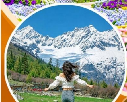
ภูเขาสิ่ดรุณี ช่วงเดียวโกว (รวมรถอุทยาน)