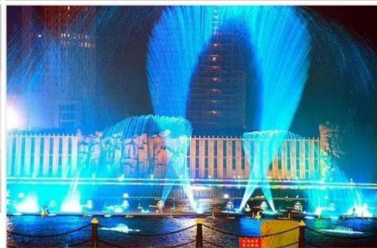
น้ำพุคังปาซือ Kangbashi Fountain