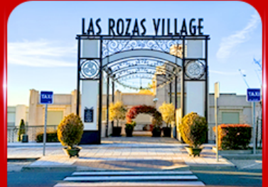
Las Rozas Village เอากีเลียน