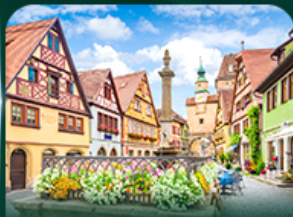
โรเรนเบิร์ก ออน เดียร์ เทาเบอว์