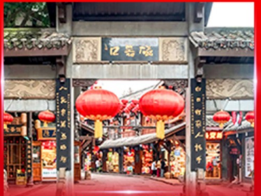
หมู่บ้านโบราณฉิวซีโหว่