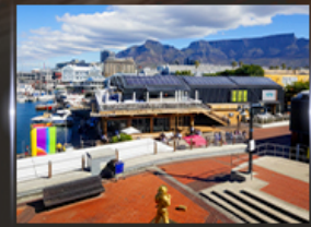
ท่าเรือ V&A waterfront