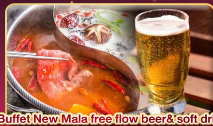
*Buffet New Mala free flow beer & soft drink