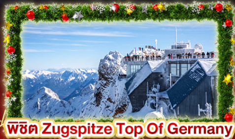
พีชิต Zugspitze Top Of Germany