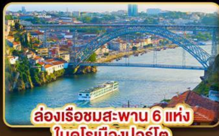
ล่องเรือชมสะพาน 6 แห่ง ในคูโรเมืองปอร์โต