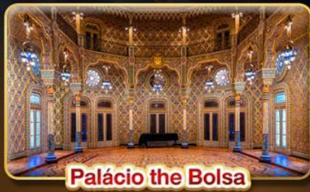
Palácio the Bolsa

119,999.- ราคาเริ่มต้น เดินทาง : 01-10 พ.ค. | 29-07 มิ.ย. | 09-18 ต.ค. 69