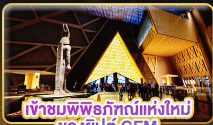
เข้าชมพิพิธภัณฑ์แห่งใหม่ ของอียิปต์ GEM