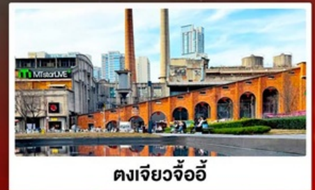
ตงเจียวจ้ออ๋