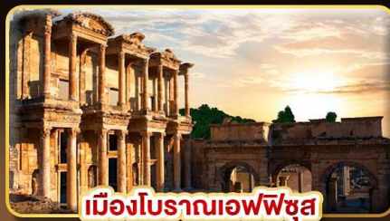
เมืองโบราณเอฟเฟซุส