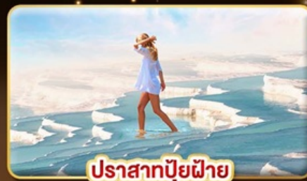
ปราสาทบูยญา