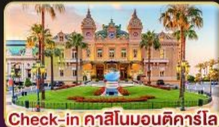
Check-in คาสีโนมอนติคาร์โล