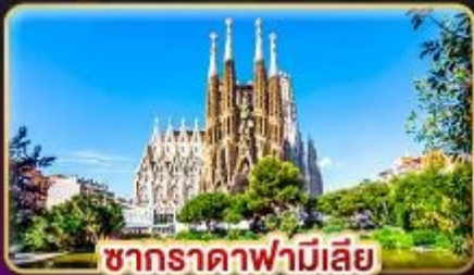
ซากราตาฟามีเลีย