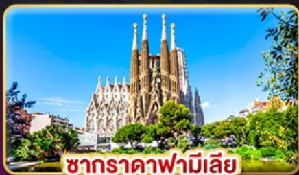
ซากرادาฟามีเลีย

สัมผัสเสน่ห์ลาเวนเดอร์ "โปรวองซ์" แห่งฝรั่งเศสใต้