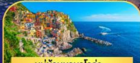
หมู่บ้านมานาโรล่า