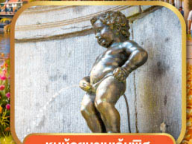
หนูน้อยมานกันพิส