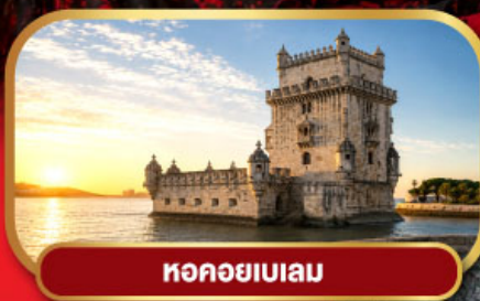
หอคอยเบเลม

ขึ้นกระเช้าไฟฟ้า อารามมอนต์เซอริต กับตำนาน Black Madonna