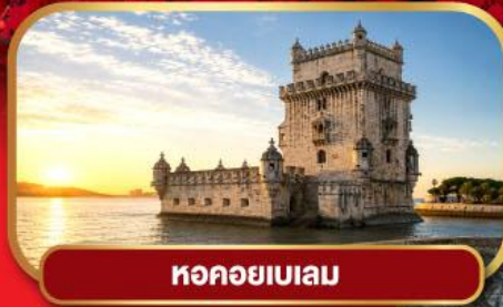
หอคอยเบเลม