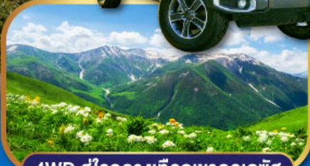
4WD สู้อุโมงค์กลางเทือกเขาคอเคซัส