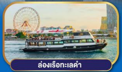
ล่องเรือทะเลดำ