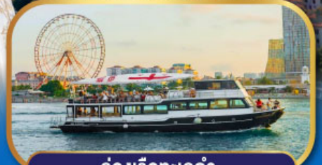
ล่องเรือทะเลดำ