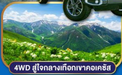
4WD สู่ใจกลางเทือกเขาคอเคซัส