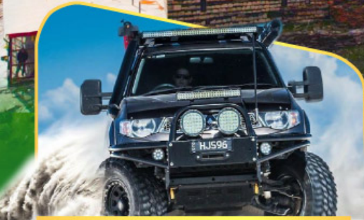
ขึ้นรถ 4WD สู้ใจกลางเทือกเขาคอเคซัส