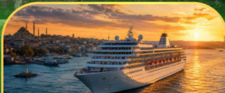
ล่องเรือทะเลดำ