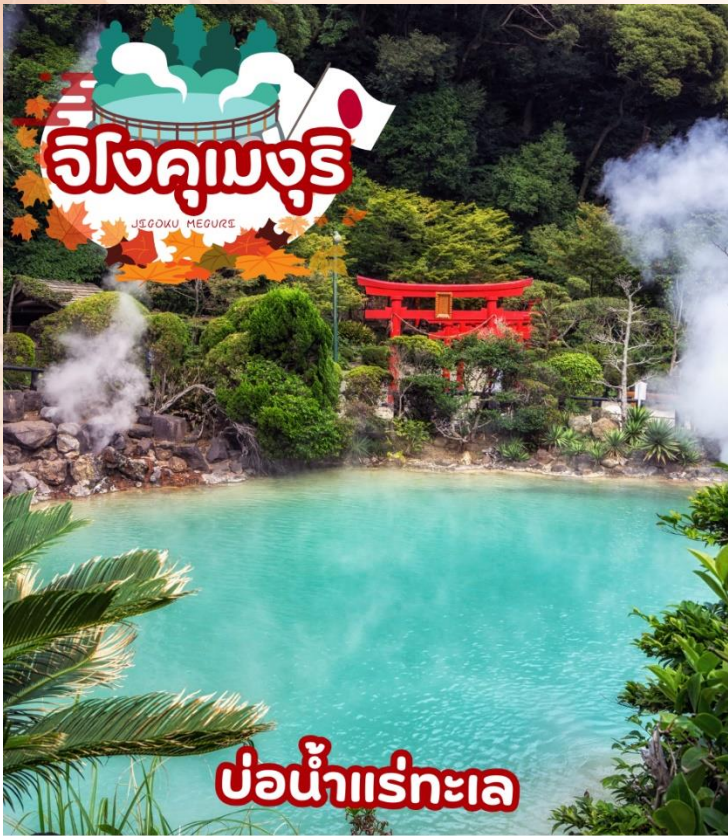
บ่อน้ำแร่ทะเล